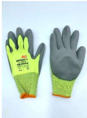
FOTO GUANTO PHOTO OF GLOVE

The PPE type complies with the applicable essential health and safety requirements of Regulation (EU) 2016/425.